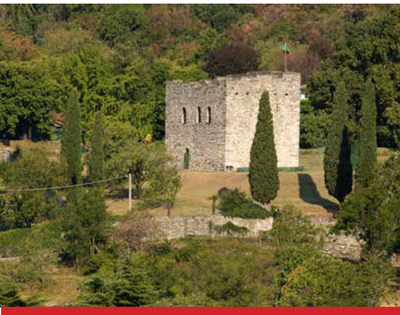
La "Torre della Ghita" sul colle Molvesio

Eupilio si trova in una zona collinare tra il Lago Segrino ed il lago di Pusiano alle pendici del monte Cornizzolo.