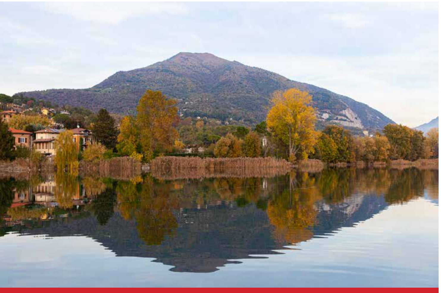
Il lago di Pusiano, Penzano e il Cornizzolo

ta") richiama infatti direttamente l' Eupilis lacus della Historia naturalis di Plinio il Vecchio (cioè il Lago di Pusiano) riverberato poi nel "vago Eupili mio" del Parini.