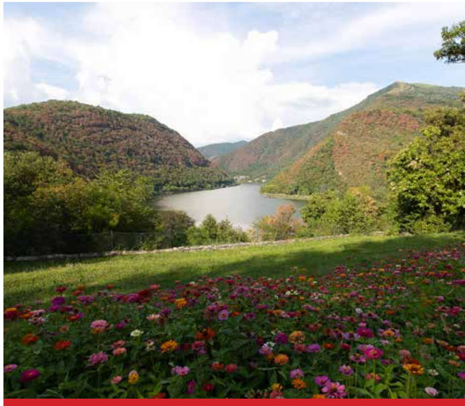
Il lago Segrino visto dal colle Molvesio

tini, che scelse Eupilio per la sua natura incontaminata tra ville, chiese ed edifici storici.